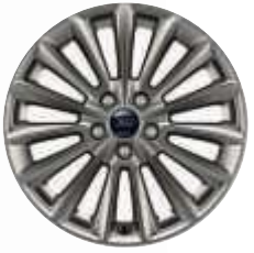
17" Rock Metallic könnyűfém keréktárcsák

Focus ST-Line Frozen White* fényezéssel és 18" Rock Metallic fényezésű könnyűfém-keréktárcsákkal. Focus ST-Line Moondust Silver* fényezéssel és 18" Rock Metallic könnyűfém-keréktárcsákkal.