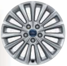
17"-os könnyűfém keréktárcsák - opcióként választható