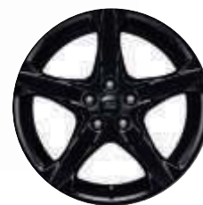
18" 5 küllős Shadow Black könnyűfém keréktárcsák - alapfelszereltség

Focus ST-Line Red & Black (Red) 18" Shadow Black könnyűfém-keréktárcsákkal. Focus ST-Line Red & Black (Black) 18" Shadow Black könnyűfém-keréktárcsákkal.