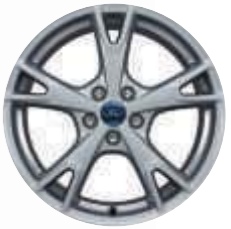
18"-os könnyűfém keréktárcsák - opcióként választható *Feláron.